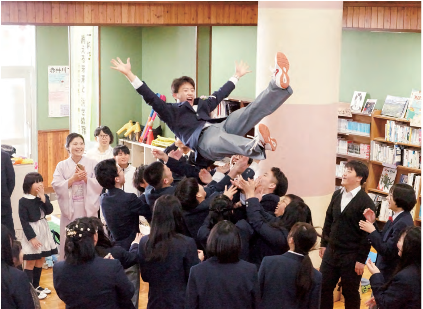
赤井川中学校卒業式／2026年3月14日