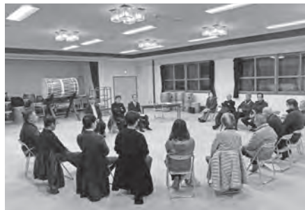
区会懇談会の様子

↓当村はしりべし空き家バ ンクに加入していますが、 村内で空き家を登録して いる人がおらず、制度を 活用して売買される方が いない状況です。