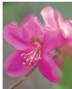
村の花：ムラサキヤシオ