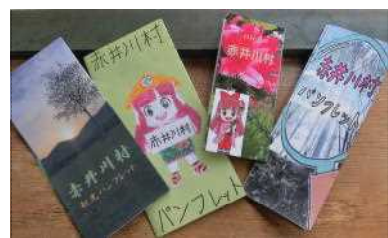
写真教室の成果、手書きの地図やコメント、QRコードなどが盛り込まれ、高い完成度!

マスク着用、手指消毒、黙食・黙浴、周りの人への一層の配慮…現在の社会の中で必要となったことを学校や家庭で身につけ、当たり前実践できました。「本当に泊まったの?」と思うほどに整頓された部屋を見て思いました。「うちの子はやっぱり○○○!」