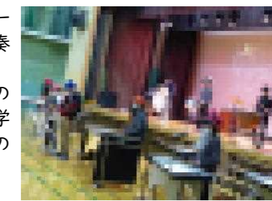
6年生「彼こそは海賊」

最後は6年生の発表です。小学校生活最後の学芸会で、クラス全員が丸となって「地域学習のまとめ」と「自分たちの6年間の歩み」、器楽合奏を発表しました。完成度が高く内容の濃いプレゼンは「さすが最上級生」と感動させられました。続いて行われた「千本桜」と「彼こそは海賊」の合奏も、息をのむ緊張感のある発表でした。「終わりの言葉」では、最高学年として6年生1人1人が各学年の学芸会に向けてのがんばりや、当日の発表について賞賛の言葉を送ってくれました。