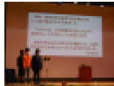
3年生「学校のまわりの生き物」

2・3年生は学年ごとに生活科・総合的な学習の時間の学習成果を発表した後、器楽演奏を披露しました。2年生は「村探検」の取材場面を劇形式で発表し、3年生はiPadを自分たちで操作して、「学校のまわりの生き物」について発表しました。聞き手を意識して分かりやすく、聞き取りやすく発表しようと、お客さんに呼びかけるように発表する姿は大きな成長を感じさせてくれました。