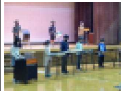
四・五年生「炎(ほむら)」

4・5年生は器楽演奏とその合間に寸劇を交えた発表でした。観客を飽きさせない工夫が随所にちりばめられていて、「さすが高学年」と感心させられました。器楽演奏は「炎(ほむら)」と「カイト」の2曲です。曲想を意識して音色に強弱をつけて演奏するなど、これも高学年らしい、立派な発表だったと思います