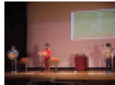
1年生「おおきなかぶ」

1年生は音読発表と音楽発表でした。音楽発表では、3人で「きらきらぼし」をアレンジしながら一人ずつ演奏しました。緊張しながらも最後までしっかりとやり切る姿は、入学時に比べて、とても成長した姿を見せていました。