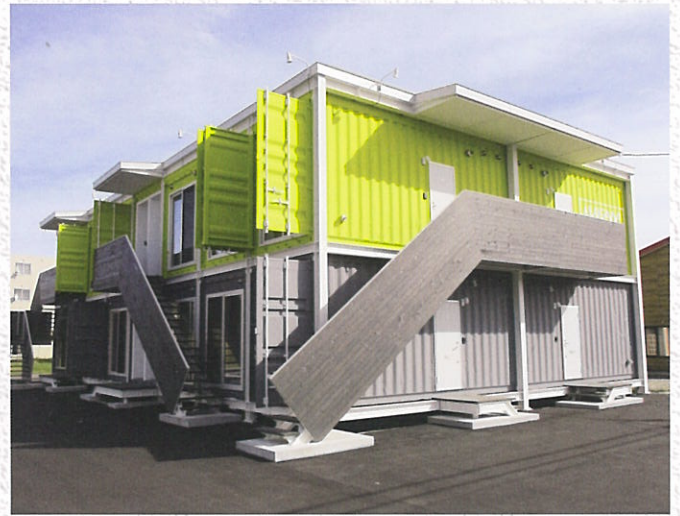
平成29年8月に完成した共同住宅【グランテラス 2棟24戸】