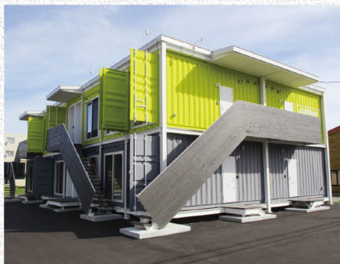
平成29年8月に完成した共同住宅【グランテラス 2棟24戸】