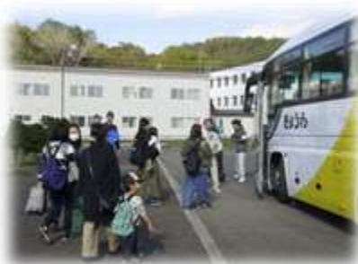
住民避難訓練 （バスによる避難）