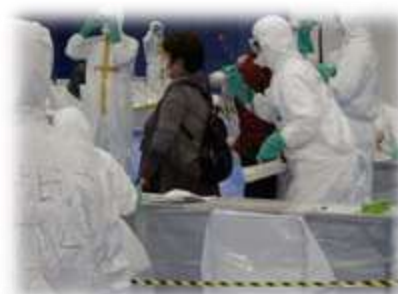
原子力災害医療活動訓練 （避難退域時検査）