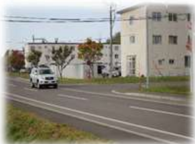
広報訓練 （広報車による広報）