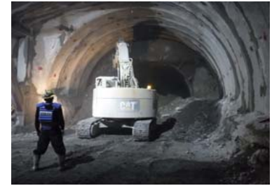
路盤の内トンネル工事進捗状況