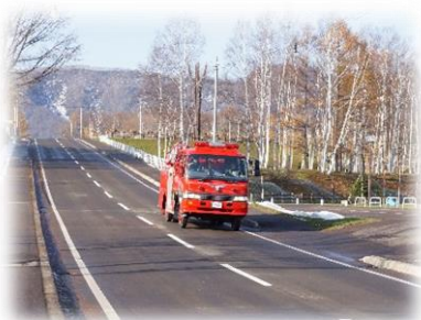
広報訓練 （広報車による広報）