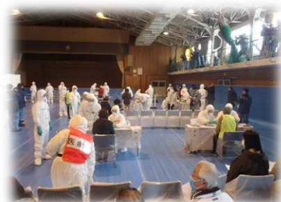
原子力災害医療活動訓練 （避難退域時検査）