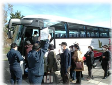
住民避難訓練 （バスによる避難）