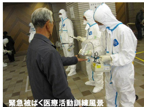
緊急被ばく医療活動訓練風景