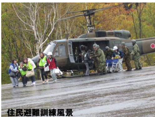
住民避難訓練風景